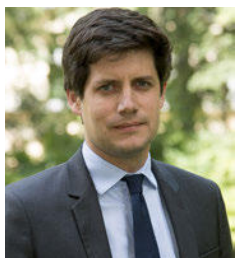
Julien Denormandie, ministre de l'Agriculture et de l'Alimentation

La crise de la Covid-19 a rappelé l'importance stratégique de notre agriculture. La mobilisation sans faille de l'ensemble de la chaîne agricole a permis de garantir à tous les Français, dans l'Hexagone et dans les Outre-mer, un accès à l'alimentation. Grâce aux efforts des femmes et des hommes de la ferme France, produire notre alimentation sur notre territoire est un atout pour assurer notre souveraineté alimentaire. Si la chaîne a tenu durant la crise, celle-ci a aussi révélé nos vulnérabilités à même de fragiliser notre indépendance alimentaire. Le paradoxe est connu : la France est la première puissance agricole en Europe mais nous dépendons encore de trop d'importations, par exemple en protéines. La priorité du plan de relance, et les moyens déployés sont à la hauteur, est la reconquête de cette indépendance .